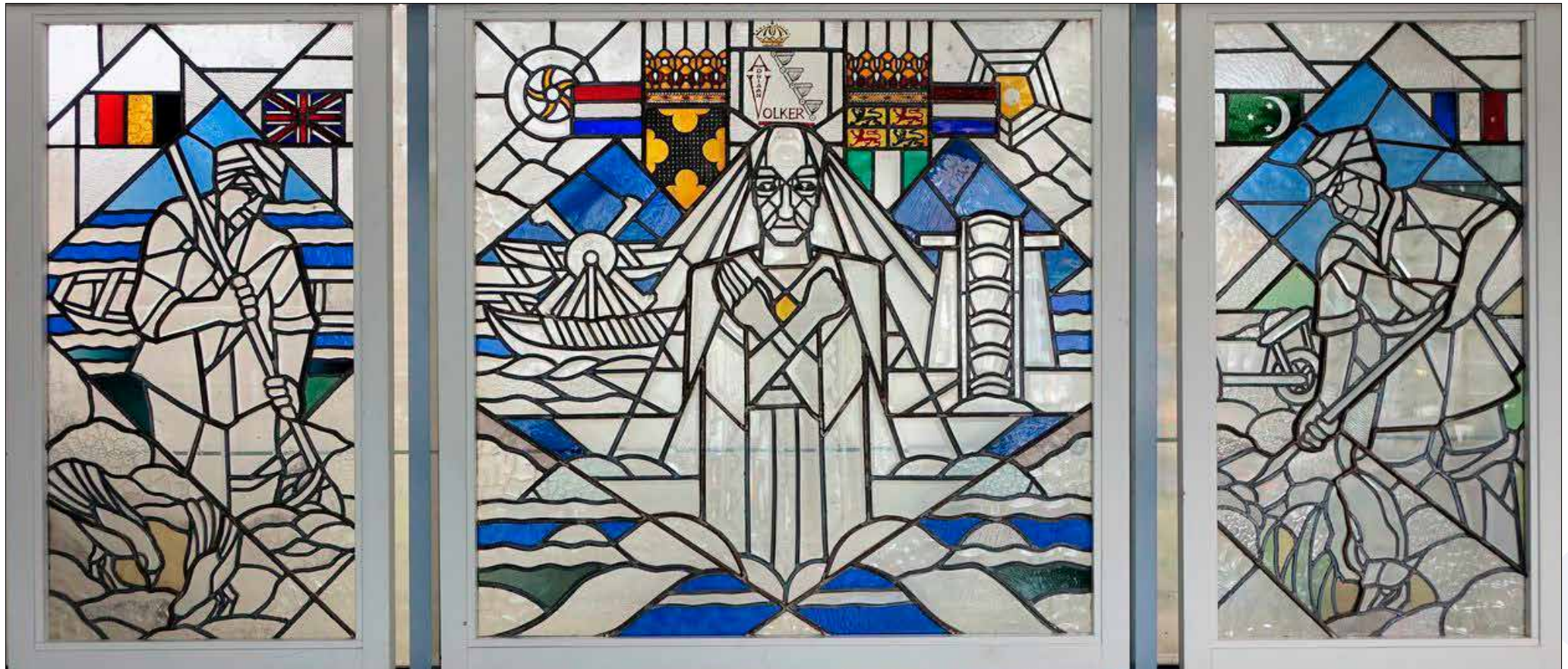
Geschonken door personeel bij 100-jarig bestaan Adriaan Volker Baggermaatschappij