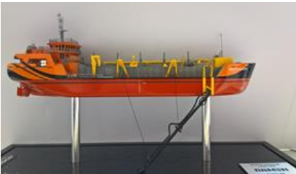
AllOnScale, Papendrecht: Model sleehopperzuiger BARITO.