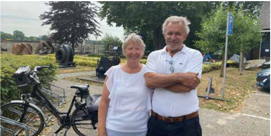
Onze eerste bezoekers na de Lockdown I

museum hiervoor geselecteerd. Na het bezoek aan het Baggermuseum werd in het gemeentehuis van Sliedrecht een lezing gehouden over de ontstaansgeschiedenis van het baggerdorp met uitleg over de fraaie gebrandschilderde ramen in de trouwzaal. Eind november kon het museum beperkt worden opengesteld en werd 16 december opnieuw weer gesloten. In deze korte heropeningstijd bleef het museumbezoek heel matig. Bezoekers dienen zich online aan te melden. Meerdere musea hebben de mogelijkheid dat het bezoek via een geautomatiseerd systeem zich aanmeldt. Het Nationaal Baggermuseum heeft deze mogelijkheid niet, vrijwilligster Tine houdt de aanmeldingen via de mailing bij.