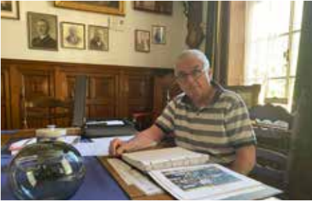
Foto's gemaakt voor en tijdens de filmopnames