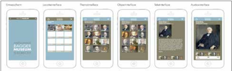
Concept vormgeving voor mobiele telefoon

Het systeem is gekoppeld aan het crs-systeem. Bij het verplaatsen, verbouwen van het museum blijft de content online, gekoppeld aan de betreffende objecten en gaat deze niet verloren. Daarnaast vergemakkelijkt deze nieuwe manier van ontsluiten de overstap naar online ontsluiten. Dit is een belangrijke en essentiële ontwikkeling die wij de komende jaren zullen doormaken. Het maakt ons meer bereikbaar en zichtbaar voor bezoekers en bij een mogelijke verhuizing of verbouwing blijft onze collectie zichtbaar en bereikbaar. Dit is in lijn met internationale museale ontwikkelingen. De verwachting is dat we voor de zomervakantie de beide routes gerealiseerd hebben. Een kinderroute zou een volgende stap kunnen zijn.