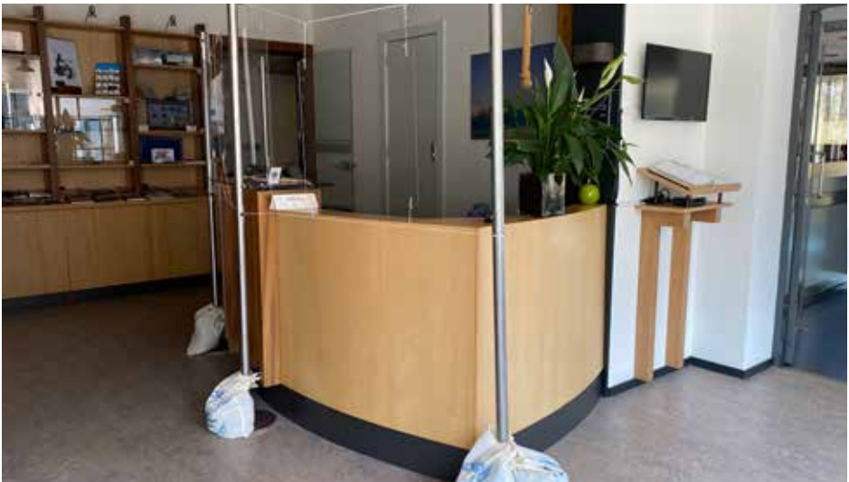
De balie in corona tijd